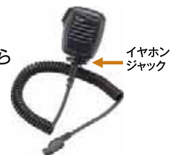
イヤホン ジャック

●上記システムはモデルケースです。実際の導入にあたっては、事例ごとに技術的・法的な検証や調整を行なうため、異なる機器やサービスを組み入れることや、導入できないこともあります。また、システムの概要をご理解いただきやすくするため、HUBやアンテナなど一部の機材を省略しております。