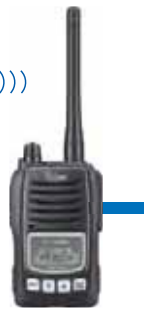
デジタル簡易無線機