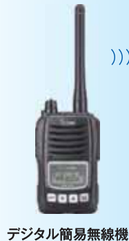
デジタル簡易無線機