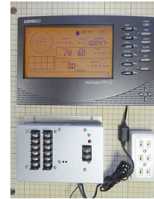
商用電源仕様イメージ